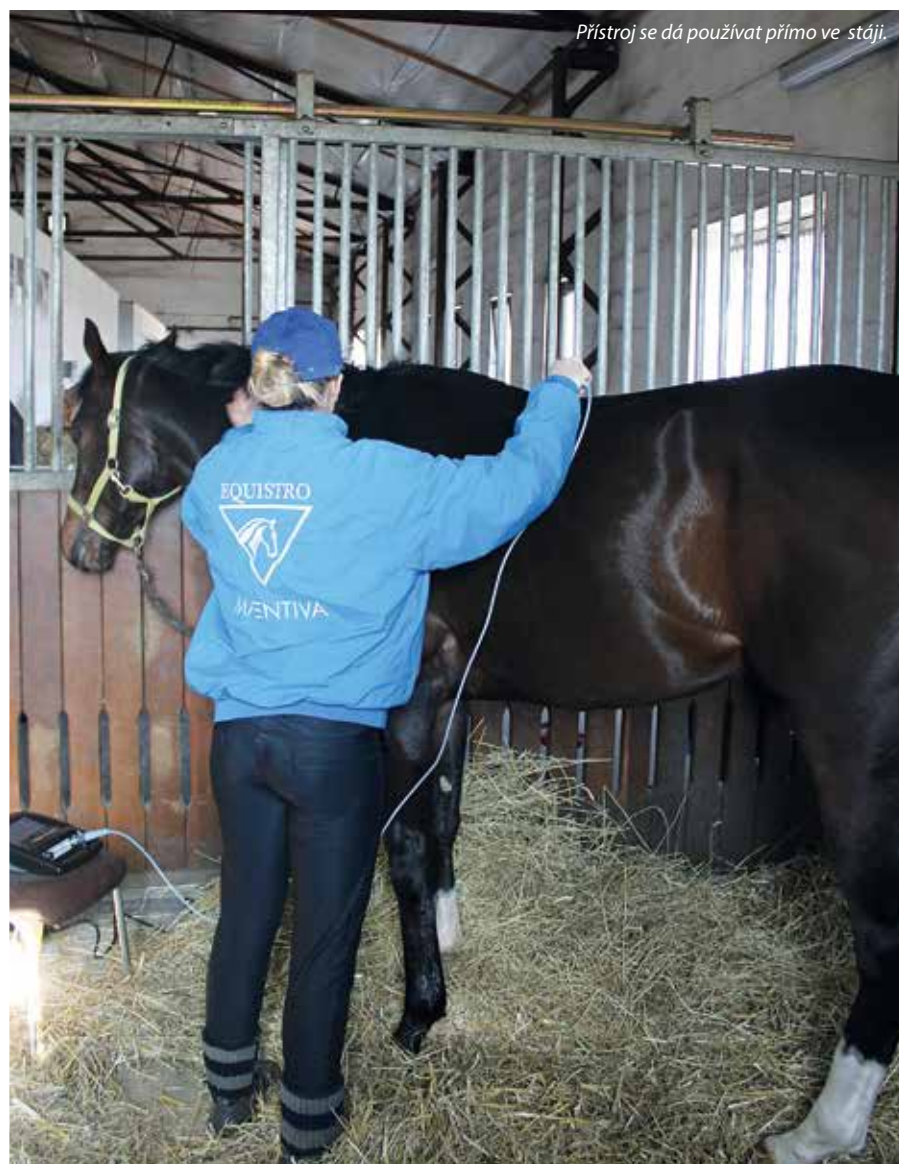
Přístroj se dá používat přímo ve stáji.