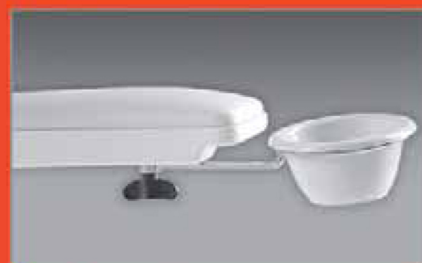
Coppia bacinelle manicure Manicure bowl couple