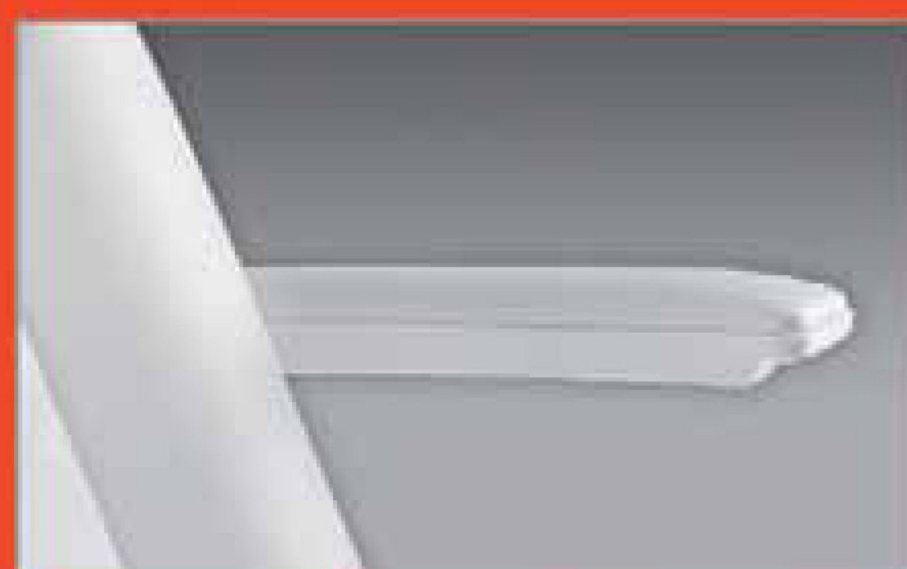
Coppia braccioli automatici Flat arm rest couple