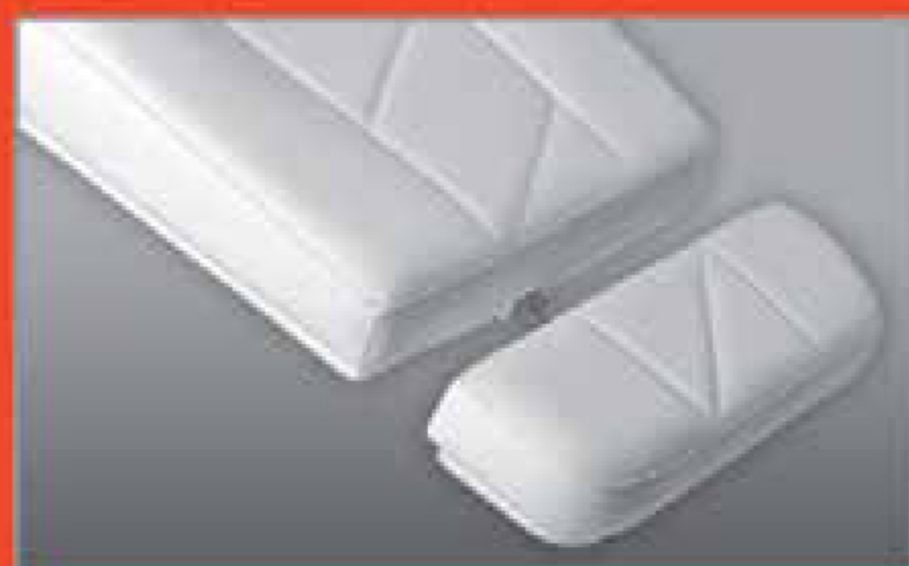
Materasso anatomico Anatomic mattress