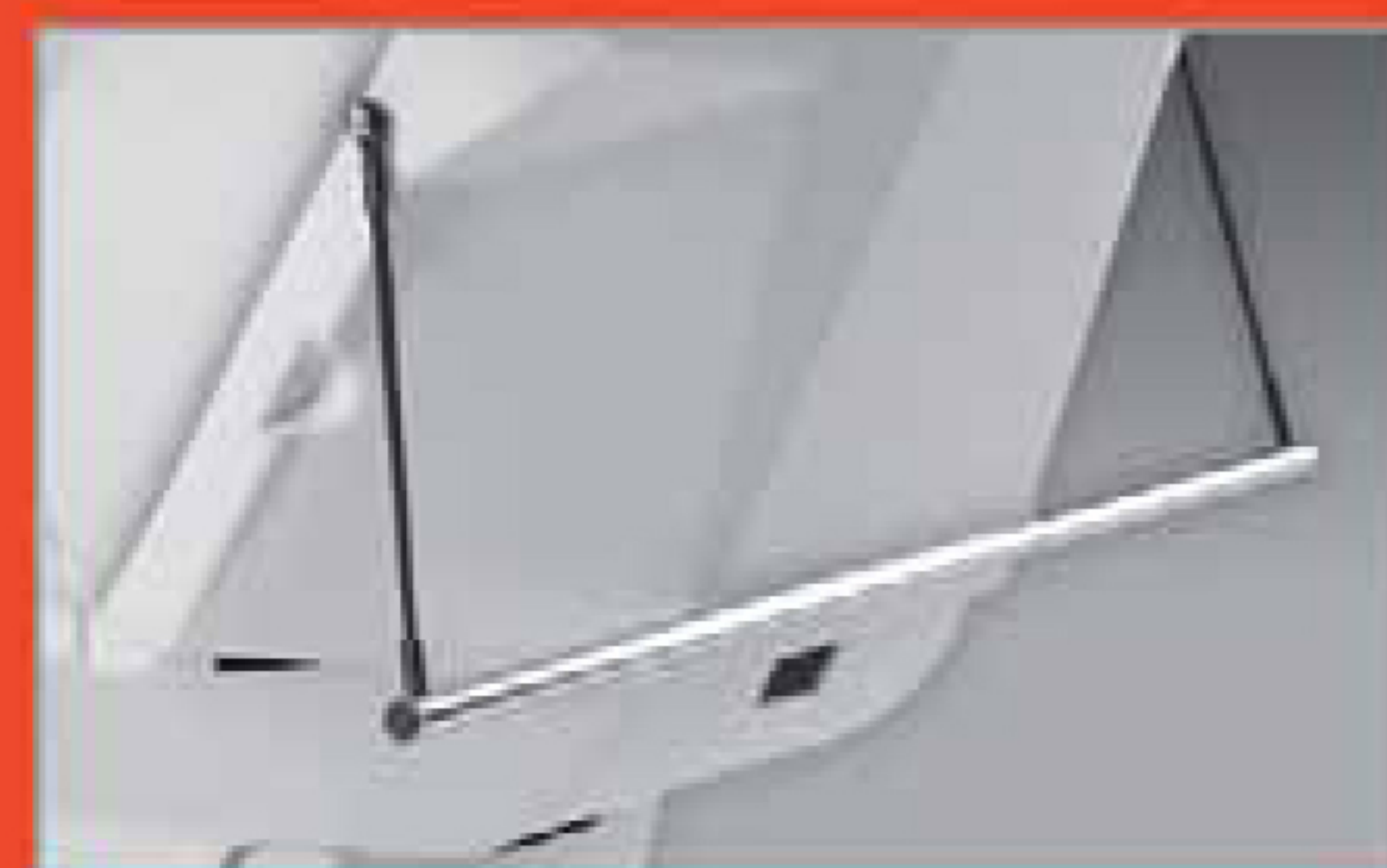
Portarotolo Roll holder