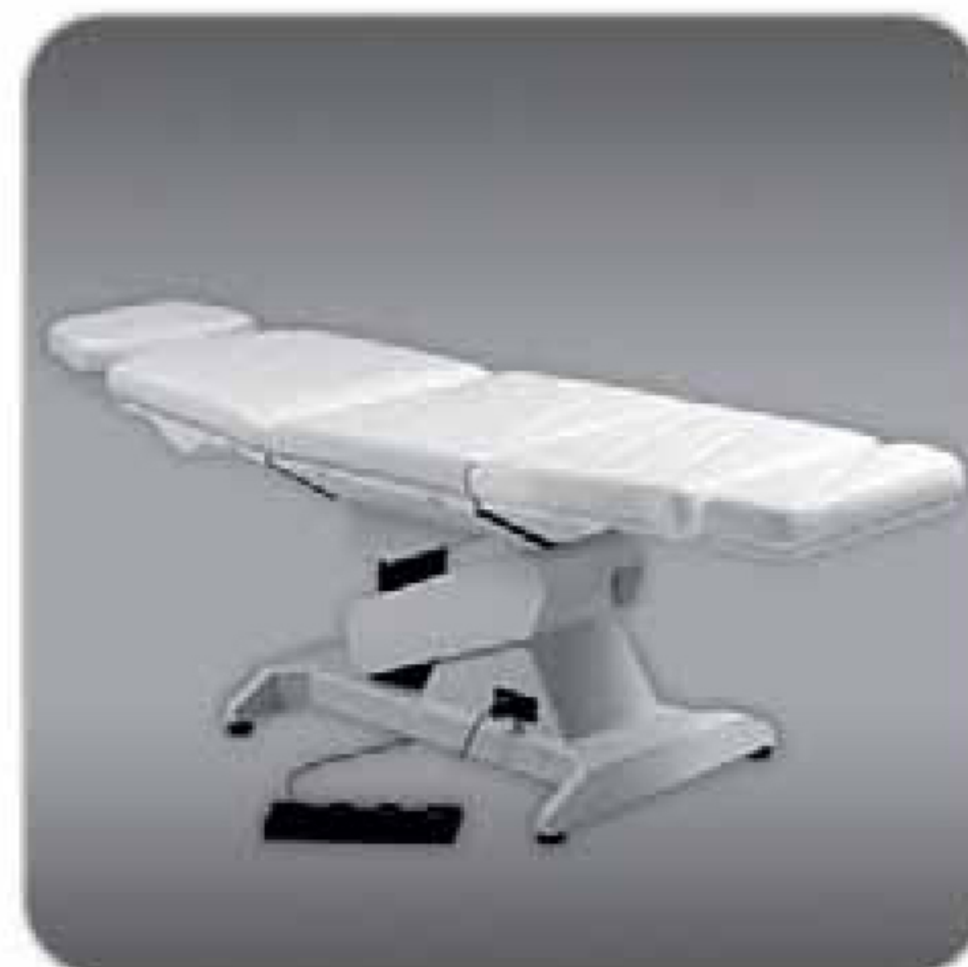
Cod.104 Versione standard / Standard version