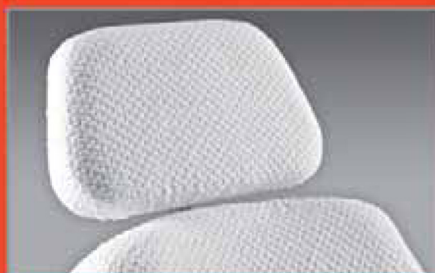
Copriletino Bed sponge cover