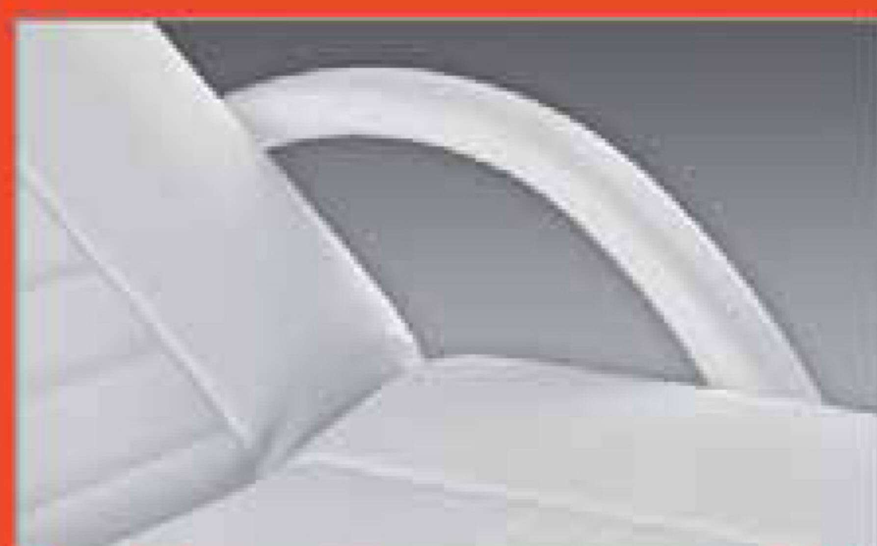
Coppia braccioli curvi Curved arm rest couple