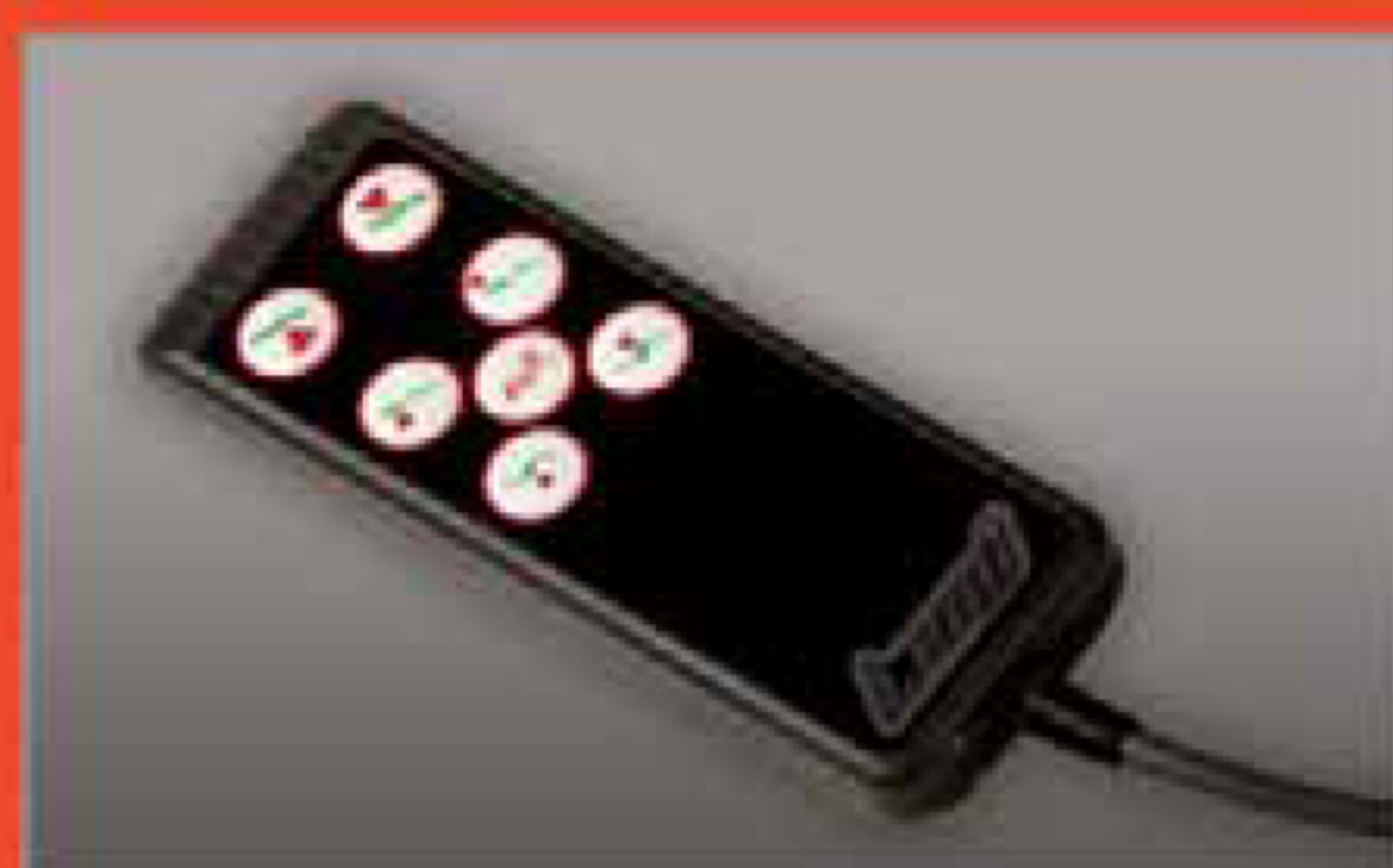
Pulsantiera Hand set control