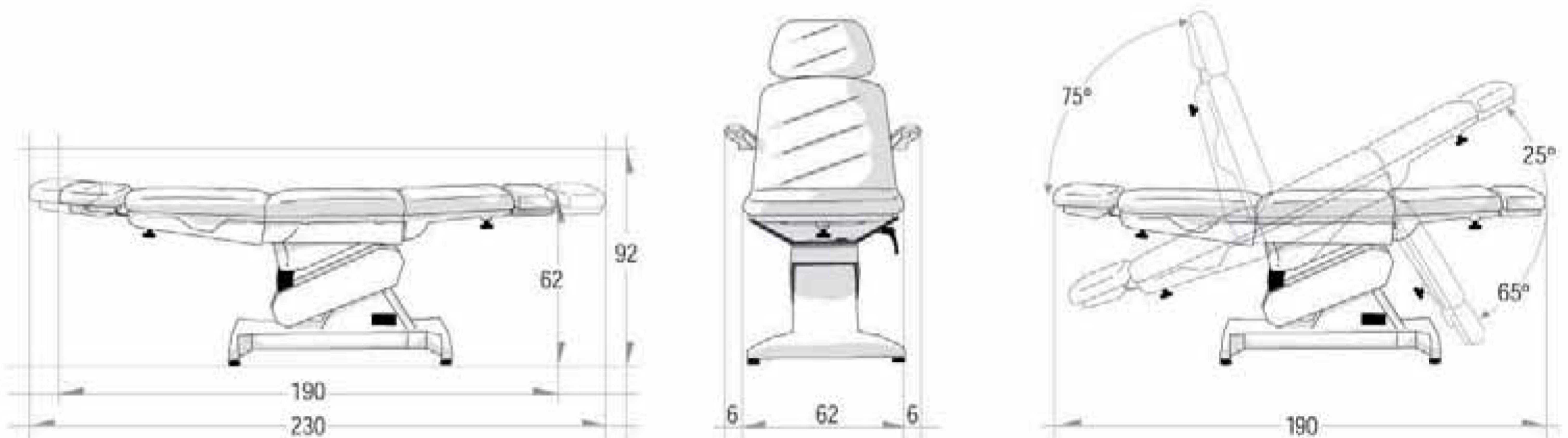
TABELLA DIMENSIONALE [cm] / TABLE OF DIMENSIONS [cm]

Il carter è disponibile nei seguenti colori / The covering is available in the following colours