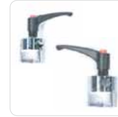
fixed and rotating armrest clamps morsetti fissi e girevoli cod. 319-320