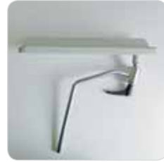
blood-sample taking armrest couple coppia braccioli da prelievo con snodo cod. 314