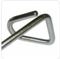
heel support couple coppia di reggi tallone cod. LEM - 151