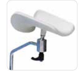
jointed thigh support couple coppia reggicosce con snodo cod. 318