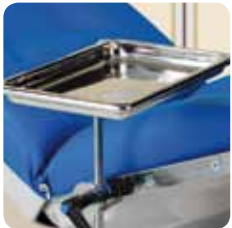
metal tray with support vassoio con supporto cod. 331