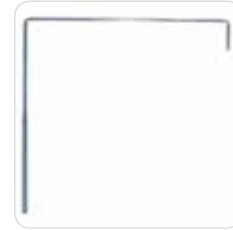
curtain-holder reggitelo cod. 315