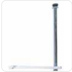
colposcope support supporto colposcopio cod. 312