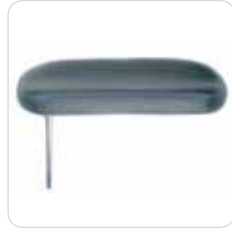
medical armrest couple coppia braccioli medicali cod. 313