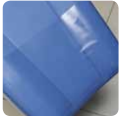
plastic cover proteggi gambe cod. Prot. gambe