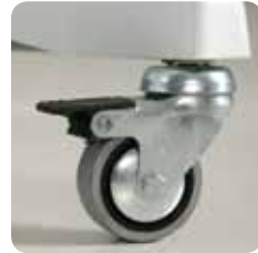
wheels ruote cod. LEM - 139