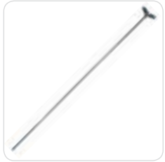
IV. rod asta porta flebo cod. 311