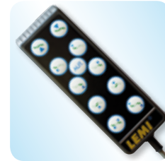
hand set control pulsantiera cod. LEM - 083